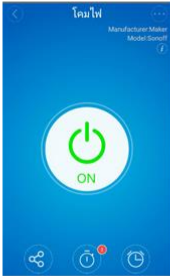
Share Schedule Timer